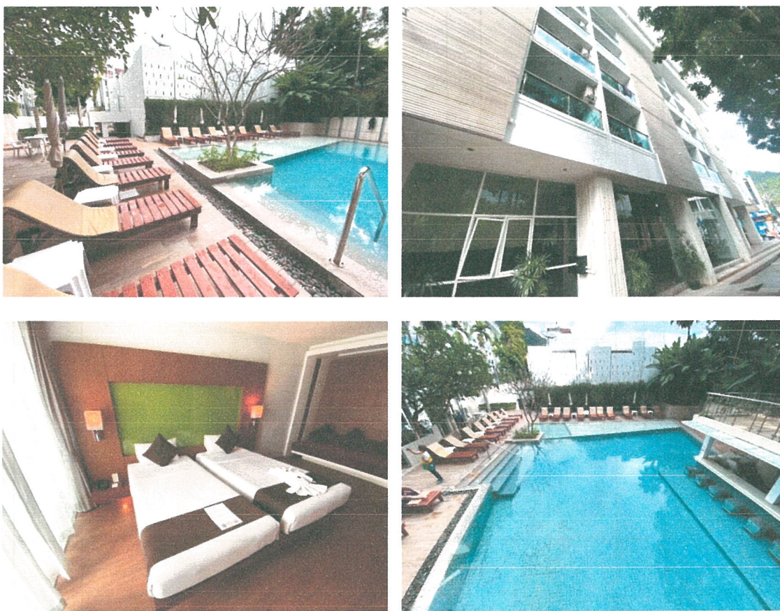
รูปภาพที่ 1.3 การใช้พื้นที่ของโครงการ